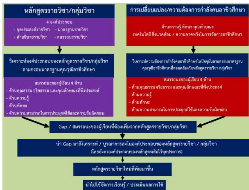
ภาพที่ 5.1 แสดงรูปแบบในการพัฒนาหลักสูตรรายวิชา กลุ่มวิชาของครูผู้สอน วิทยาลัยอาชีวศึกษาสุราษฎร์ธานี

จากภาพที่ 5.1 รูปแบบในการพัฒนาหลักสูตรรายวิชา กลุ่มวิชาของครูผู้สอน วิทยาลัยอาชีวศึกษาสุราษฎร์ธานี สามารถนำมากำหนดเป็นกระบวนการในการพัฒนาหลักสูตรรายวิชา กลุ่มวิชาของครูผู้สอนได้ 3 กระบวนการ ดังนี้