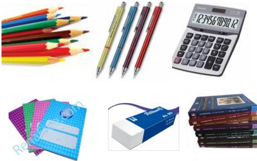
ภาพที่ 1.1 แสดงสินค้าของกิจการร้านขายเครื่องเขียน

จากความเห็นของนักวิชาการดังกล่าวสรุปได้ว่าสินค้า (Goods or Merchandise) หมายถึง สินค้าหรือสิ่งของที่กิจการค้ามีไว้เพื่อจำหน่าย โดยมีวัตถุประสงค์เพื่อแสวงหากำไร ดังนั้นเจ้าของกิจการจึงมีรายได้จากการขายสินค้าเป็นหลัก ตัวอย่าง ร้านอักษรทองจำหน่ายสินค้าประเภทเครื่องเขียน เช่น ปากกา ดินสอ ยางลบ หนังสือ สมุด เครื่องคำนวณเลข เป็นต้น